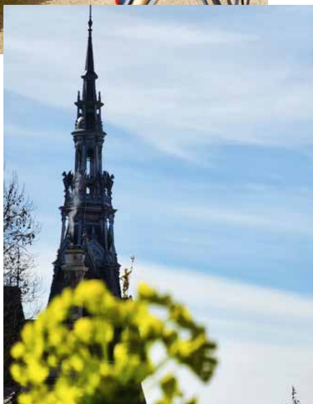
Ici une photo de @ladubcapture sur Instagram #SensMaVille #SensIntense