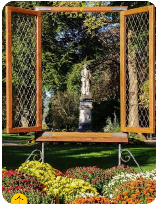
Une photo de @ville_de_sens sur Instagram

Tél. 03 86 95 67 00 - www.ville-sens.fr - e-mail : web@mairie-sens.fr