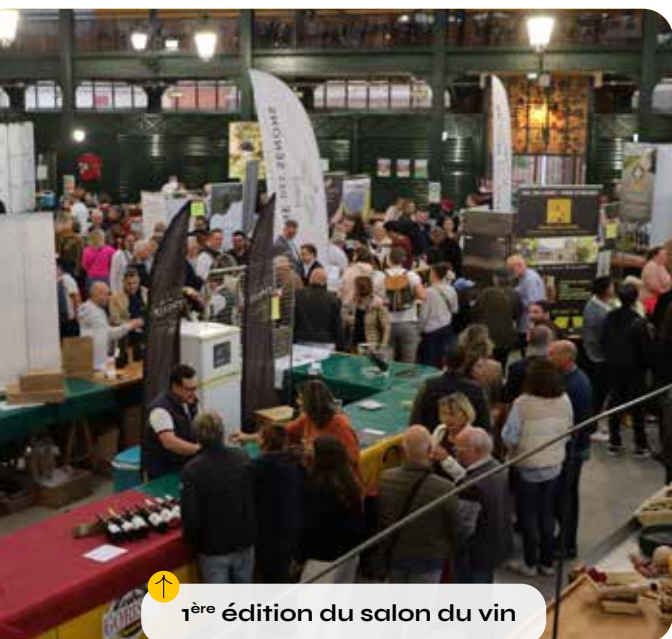
↑ 1 ère édition du salon du vin