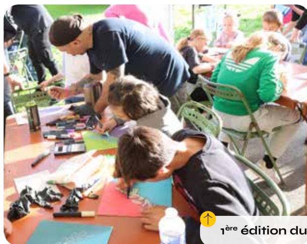
↑ 1 ère édition du Sens Urban Fest'