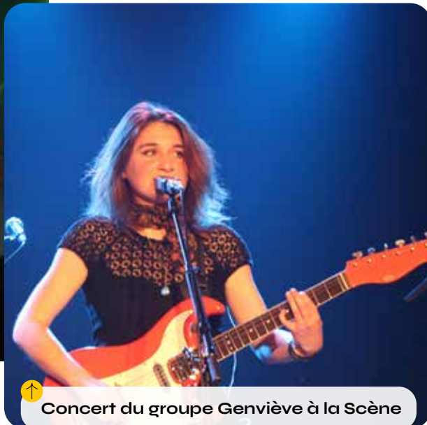
↑ Concert du groupe Genviève à la Scène