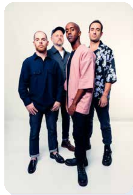
Now beauty

Un Pass Jazz permet d'assister aux trois concerts pour 48 € : l'occasion idéale de (re) découvrir l'effervescence du jazz contemporain en plein cœur de Sens.