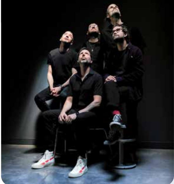
Living being ©Elisa Ramirez