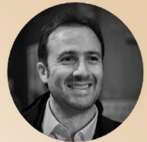
Olivier Marchal Parrain de cette 4 e édition