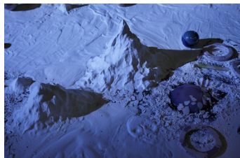
Cossöcossömogonie par Lei Saito

L'artiste japonaise Lei Saito a le goût des paysages et conçoit les siens comme des « horizons délicieux ». À l'aide de matières organiques, Lei concocte une « cuisine existentielle », faite de montagnes et de vallées comestibles. En parallèle de l'exposition Synode, parler le paysage où se trouve sa sculpture intitulée Cossöcossömogonie , et à l'occasion de la Nuit des Musées, Lei Saito invite le public à découvrir la « fabrique » de ses paysages au travers d'une nouvelle performance mariant la gelée, le cacao, les algues et même le charbon de bambou, elle fait jaillir des rochers et invente de nouvelles recettes pour nos imaginaires.